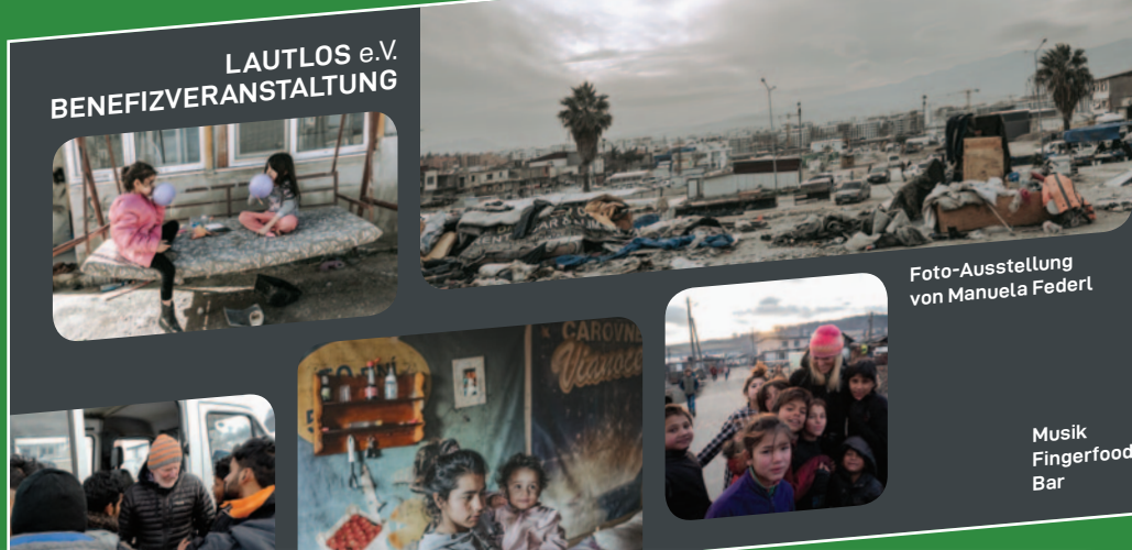
LAUTLOS e.V. BENEFIZVERANSTALTUNG