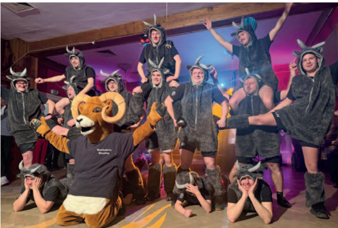
Höhepunkt des Faschingsballs war der Auftritt des Hörpoldinger Burschenvereins. Getreu ihrem Motto „De Goaß is hoäß“ traten sie als adrette Goaß auf und verzauberten so das Publikum.

ger Burschenverein, der im Juli das 59. Burschengaufest ausrichtet. Passend zu ihrem Motto „De Goaß is hoäß“ traten sie als Ziegen und Geißlein auf und sorgten für eine bombastische Show in ihren wollig warmen Kostümen - eine Tanzgarde vom anderen Stern mit viel Rhythmus im Blut.