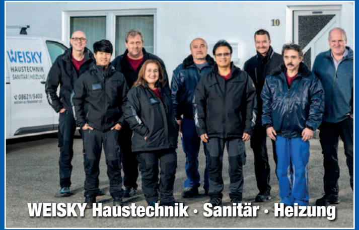
WEISKY Haustechnik · Sanitär · Heizung