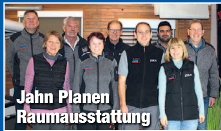
Jahn Planen Raumausstattung