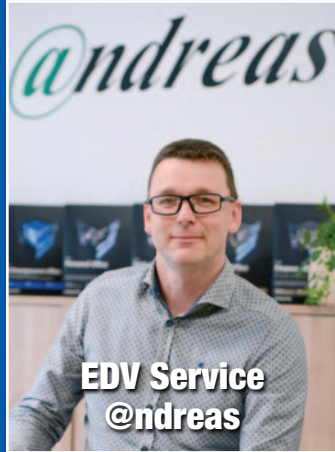
EDV Service @ndreas