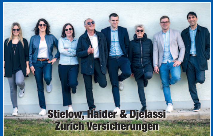
Stielow, Haider & Djelassi Zurich Versicherungen