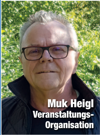
Muk Heigl Veranstaltungs- Organisation