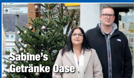
Sabine's Getränke Oase