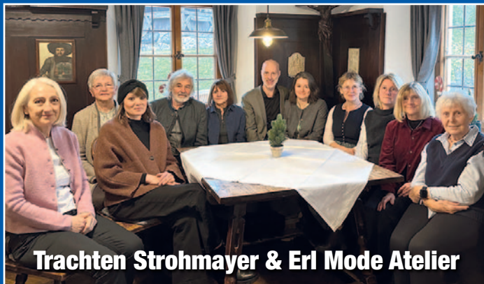
Trachten Strohmayer & Erl Mode Atelier