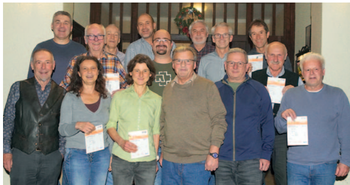
Insgesamt 27 Sportabzeichen für die Erwachsenen wurden in der Jahreshauptversammlung der Leichtathletik-Abteilung des TSV Altenmarkt verliehen. Auf dem Bild sind die anwesenden geehrten Sportler zu sehen.