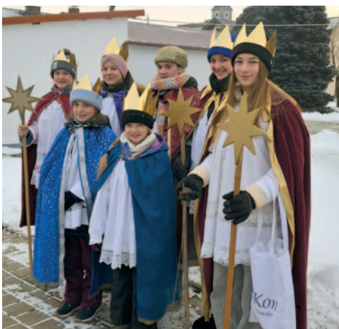
Auch in Rabenden waren verschiedene Gruppen unterwegs und sammelten für die Sternsingeraktion der Pfarrei.