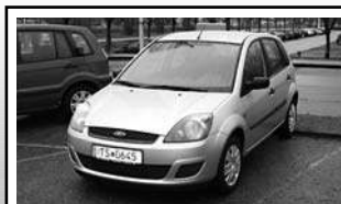
Ford Fiesta „Fun X“ 5trg. 1,4 Ltr., 59 kW (80 PS), Tageszulassung, EZ 11/07, 10 km, polarsilbermet. 12.600,-