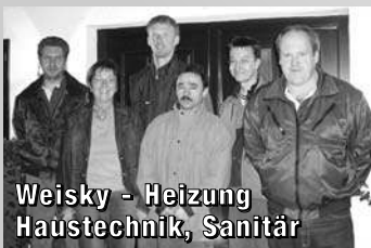
Weisky - Heizung Haustechnik, Sanitär