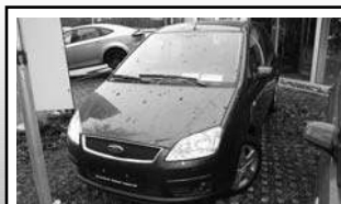
Ford Focus „C-Max Fun-X“ 5trg. 1,6 Ltr., 74 kW (100 PS), Tageszulassung, EZ 10/07, 10 km, oceanblau-met. 17.900,-