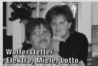
Wolferstetter Elektro, Miele, Lotto