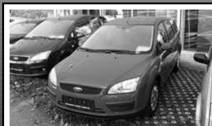
Ford Focus „Fun X“ Turnier 1,6 Ltr., 74 kW (100 PS), Tageszulassung 20 km, coloradorot 16.990,-