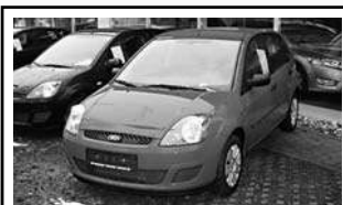
Ford Fiesta „Fun X“ 5trg. 1,3 Ltr., 44 kW (60 PS), Tageszulassung, EZ 11/07, 10 km, coloradorot 11.400,-