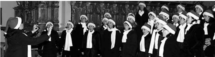
Harmonie im Akkord: der Deutsche Meister im Barbershop-Gesang, die „Harmunichs“ aus München gaben ein kostenloses Konzert in der Stiftskirche.