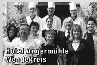
Hotel Angermühle Wendekreis