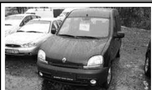
Renault Kangoo „Privilege“ 1,4 Ltr., 55 kW (75 PS), aus 1. Hand, scheckheftgepflegt, EZ 1/02, 84.000 km, dunkelblau-met. 6.950,-

Dr.-Albert-Frank-Str. 16 83308 Trostberg Tel. 0 86 21/98 39-16 Fax 0 86 21/98 39 39