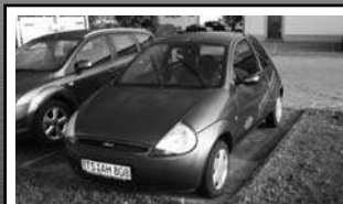
Ford KA „Fun X“ 3trg. 1,3 Ltr., 44 kW (60 PS), Vordrühwagen, EZ 06/06, 14.000 km, blau-met. 8.490,-